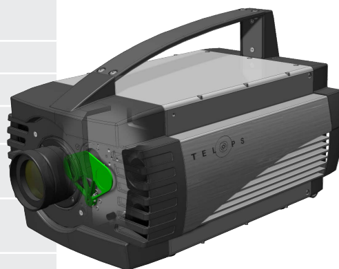
The automated 3-position filter mechanism.